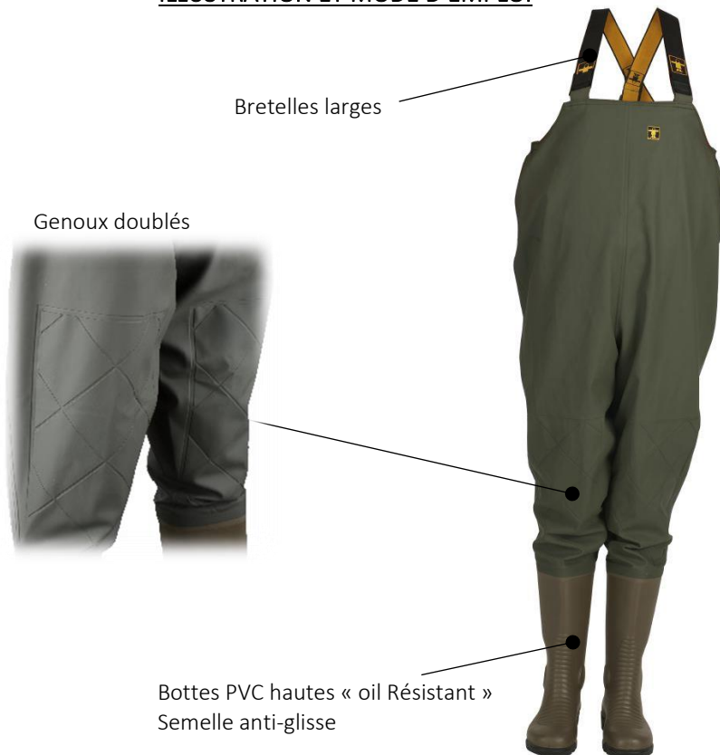
ILLUSTRATION ET MODE D'EMPLOI

EPI = Equipement de Protection Individuelle