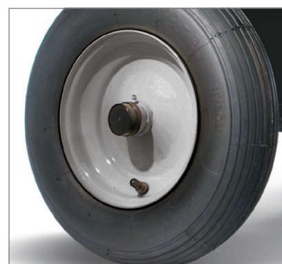
Larges roues pneumatiques