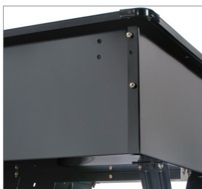
Acier solide avec une capacité de charge de 340 kg