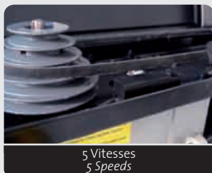
5 Vitesses 5 Speeds