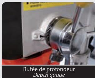
Butée de profondeur Depth gauge