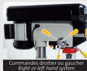
Commandes droitier ou gaucher Right or left hand system