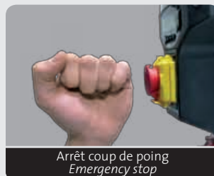
Arrêt coup de poing Emergency stop