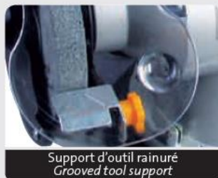
Support d'outil rainuré Grooved tool support