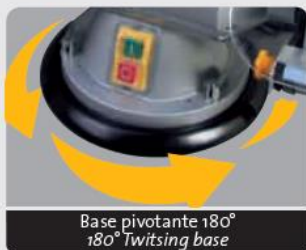
Base pivotante 180° 180° Twisting base

180° twisting bench grinder with wire brush • Built in twisting base left and right with 2 keyless locks • LED adjustable light • Safety screen • Wheel dresser