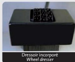
Dresseur incorporé Wheel dresser