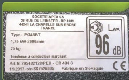
PLAQUE SIGNALÉTIQUE MOTEUR