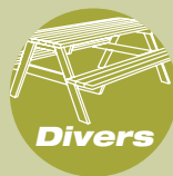
Table Chasse 1,40 m