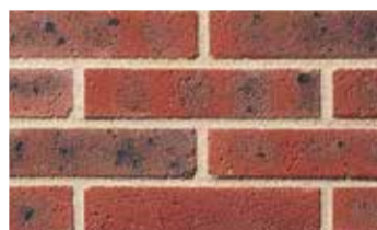
Terre de rose grenailée