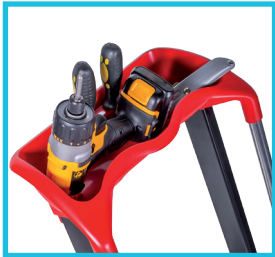
TABLETTE PORTE-OUTILS ERGONOMIQUE pour un appui confortable des jambes et de grande contenance.