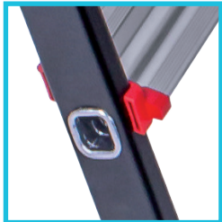
MARCHES ALUMINIUM solidement fixées aux montants par sertissage.