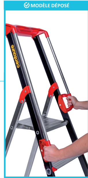
2 RAMPES D'ACCÈS EN ALUMINIUM équipées de poignées ergonomiques