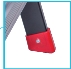
LARGES PATINS VISSÉS ANTIDÉRAPANTS POUR PLUS DE STABILITÉ.