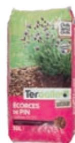
Écorces de pin Teragile

En se décomposant, le paillage organique va se transformer en humus qui enrichira la terre. Il protégera et nourrira donc vos plantations, tout en apportant une touche de décoration à votre jardin. De nombreux paillages organiques sont disponibles en magasin : paillis de chanvre, écorces de pin ou paillis de lin. La tonte de gazon ou un tas de feuilles mortes peuvent aussi servir de paillage autour d'une plantation ou dans un potager.