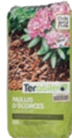
Paillis d'écorces Teragile