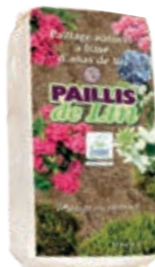
Paillis de lin