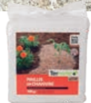
Paillis de chanvre Teragile