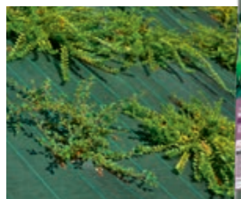
Toile de paillage Teragile