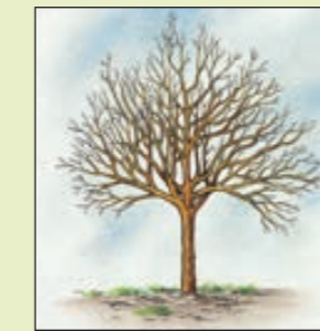
Avant la taille

Opérez sur les arbres dont la fructification est moins abondante, à la fin de l'hiver pour les espèces à pépins, en septembre-octobre pour les formes à noyaux. Sans modifier la silhouette, cette taille consiste à supprimer toutes les ramifications en sur-nombre et les plus chétives.